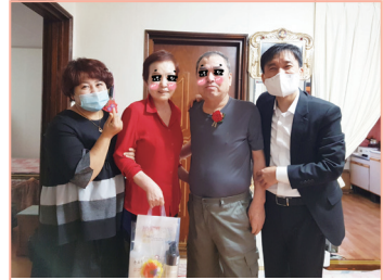
어버이날 기념 방문 [카네이션 전달](2020.5.8.)

방역물품, 밀반찬, 특별식, 생필품, 학습지, 소식지 등 어르신께서 필요한 모든 것을 총알배송!