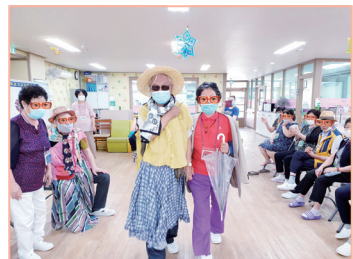
특별수업-나는 모델이다 [사회복지실습생 진행](2020.6.26.)

어떠한 위기 상황에서도 피해를 최소화하기 위한 어르신들의 적극적인 훈련 참여!