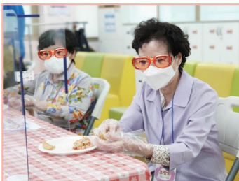
요리교실 [유부초밥 만들기](2020.6.24.)

오늘은 어르신과 어머니께서 가장 고생하신 날입니다. 많은 분들의 축하를 받으며 기쁨의 눈물을 흘리십니다.