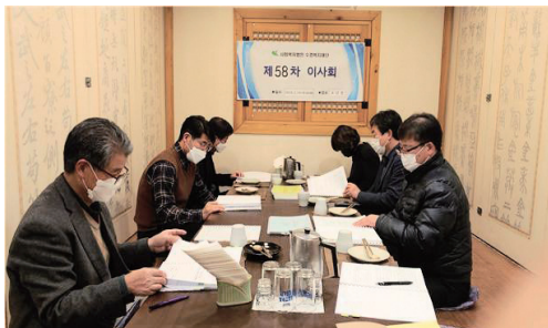
제58차 이사회(2. 18)