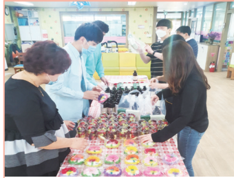
코로나19 긴급 물품지원 [어르신 댁 가정방문](2020.4.23.)

알콩달콩 우리끼리 조출한 설 잔치였지만, 다음에는 더 많은 이웃과 행복을 나누는 자리가 되길 바랍니다.