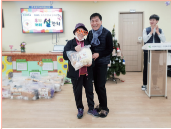
설맞이 행사 [우리끼리 설잔치](2020.1.23.)

알콩달콩 우리끼리 조출한 설 잔치였지만, 다음에는 더 많은 이웃과 행복을 나누는 자리가 되길 바랍니다.