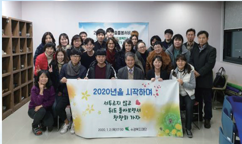
2020년 시무식(1. 2)